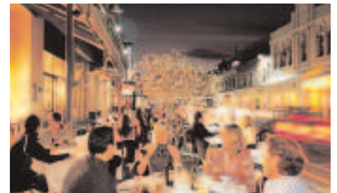
Draussen dinieren ist Teil des Lebensqualität.

Welch ein Kontrast zu heute! In wenigen Jahren hat Adelaide eine fast unglaubliche Entwicklung durchgemacht. Statt den beiden Grossen nachzueifern und dabei immer den Kürzeren zu ziehen, besann man sich auf die eigenen Stärken. Heute strahlt die Stadt mit ihren fröhlichen und betont gastfreundlichen Menschen eine einzigartige Lebensfreude aus, die auch Besucher sofort in ihren Bann zieht. Vor allem die Gegend um Rundle Street ist abends zu einem lebendigen Treffpunkt geworden, mit zahlreichen