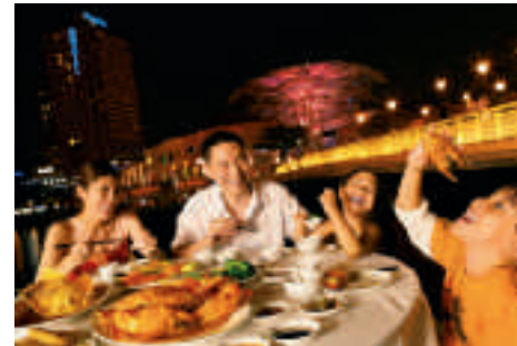
Gourmet-Fans kommen sicher auf ihre Kosten.

Und wenn von sportlichen Highlights die Rede ist, Singapur hat eine eigene Interpretation gefunden: Essen ist der Volkssport