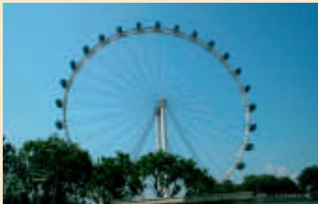
Der Flyer ist das neue Wahrzeichen von Singapur.

Was unten gemächlich beginnt, endet auf dem Höhepunkt mit einer spektakulären Aussicht auf Singapur, auf die Strandpromenade bis hinaus aufs Meer und die weiter entfernt liegenden indonesischen Inseln. Der Flyer steht direkt an den Ufern der Marina Bay und dreht sich mit seinen voll klimatisierten und luxuriös ausgestatteten Kabinen in rund 30 Minuten.