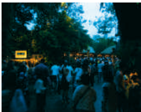
Auch die Einheimischen lieben Partys.

Singapur besteht aus einer Hauptinsel und 60 kleineren Inseln, die sich rund um die Stadt verteilen. Auf diese Inseln hinaus fahren die lokalen Bewohner gerne zum Picknicken, für Parties oder um sich den unterschiedlichsten Wassersportarten zu widmen. Diese Inseln sind gerade über das Wochenende frequentiert. Wer es ruhiger haben will, wählt einen Wochentag. Mit 697 Quadratkilometern ist Singapur kleiner als beispielsweise Hamburg.